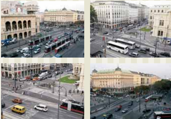
Impressionen von den einzelnen Bauabschnitten

Im zweiten Hauptabschnitt (Stubenring, Parkring bzw. Opernring, Burgring, Dr.-Karl-Renner-Ring: restliche Fahrstreifen) wurde ein gewalzter GA 11 in 3,5 cm Dicke eingebaut. Es wurde ein Bitumen B 70 unter Verwendung von 2,5 M.-% Trinidad Epuré verwendet.