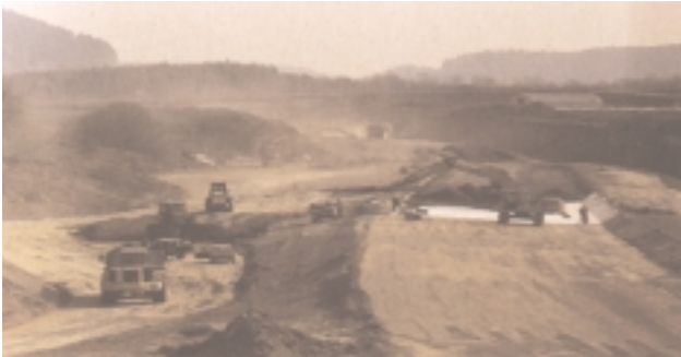
Großerbau in voller Aktion und Betonmattenverlegung in der Wasserschutzzone II

Das gleiche gilt für die vorzeitige einbahnige Inbetriebnahme des Bauabschnittes vom Baubeginn bis zur Anschlußstelle Leutkirch-Süd. Bei nur geringfügigen Mehrkosten durch zusätzliche Bauleistungen ergab sich durch den Wegfall der Ortsdurchfahrten Niederhofen und Leutkirch ein hoher Nutzen für den öffentlichen Verkehr hin-