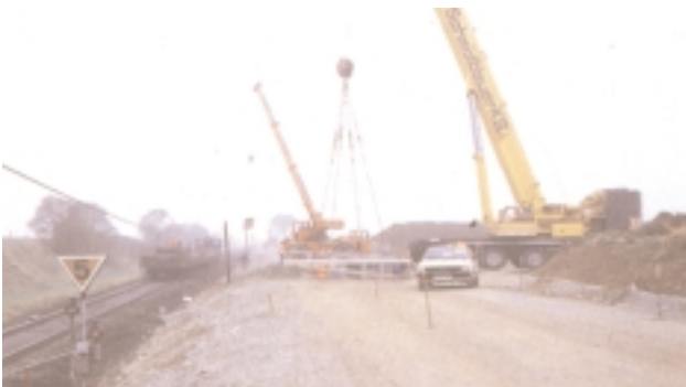
Einbau der Hilfsbrücke im Umfahrdamm für die

Neben der geologischen Situation waren folgende Randbedingungen für die Baudurchführung charakteristisch: