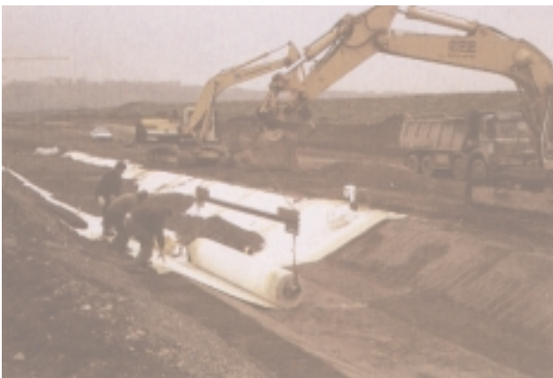
Verlegung der Bentonit- Dichtungsmatte in der Wasser- schutzzone III.

Als tiefliegende Dichtung wurde eine Bentonitdichtungsmatte ausgeführt. Tieflegend bedeutet, dass die Dichtung unterhalb der Entwässerungsanlagen angeordnet ist, wodurch problematische Durchdringungen von Schutzplanken, Entwässerungsschächten und Rohren vermieden werden. Die Dichtungsmatte besteht aus zwei miteinander vernadelten Kunststoff-Vliesen, zwischen denen eine Schicht aus quellfähigem Ton (Bentonit) als eigentliches Dichtungselement eingebracht ist. Die schubfeste Verbindung zwischen den einzelnen Bahnen wird durch Einlage eines einfachen Klettbandes in der Überlappung hergestellt. Die Anforderungen an das Entwässerungssystem lassen sich am besten mit Gussrohren erfüllen.