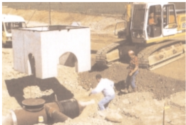
Versetzen der bodenlosen Schächte auf die Gußrohr- leitungen

Der entscheidende Vorteil ist, dass die Dichtheitsprüfung als Unterdruckprüfung mit Luft ausgeführt werden kann, statt der beim Betonrohr üblichen Wasserdruckprüfung.