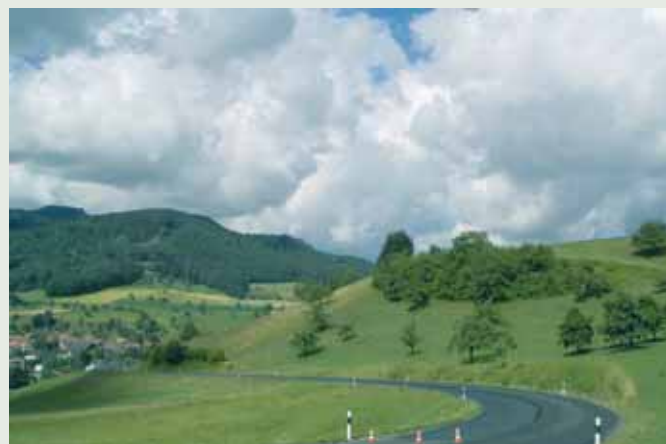
Kanton Aargau, Mülimattstraße

Im Schweizer Baudepartement Aargau, Außenstelle Frick, wurde eine Verbindungsstraße mit schwierigsten Gefälleverhältnissen unter Verwendung von TLC 50/50 ausgeschrieben. Auch hier, wie schon auf allen Strecken vorher, überzeugten hohe Marshallstabilitäten bei guter Verdichtbarkeit. Selbst ein Temperatursturz von 15 °C durch ein Gewitter während des Einbaus konnte der guten Einbaubarkeit des Mischguts nichts anhaben.