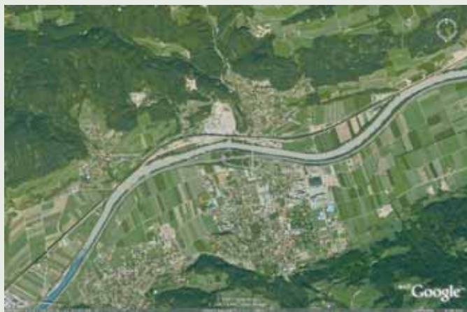
Inntalautobahn A 12 in Tirol, AS Wattens

Auf der Inntalautobahn A 12 kam TLC 50/50 an der Anschlussstelle Wattens in einem Splittmastixasphalt mit Straßenbaubitumen 50/70 zum Einsatz. Diese stark befahrene Abfahrt wurde von der Alpenschnellstraßen AG in Innsbruck ausgeschrieben.