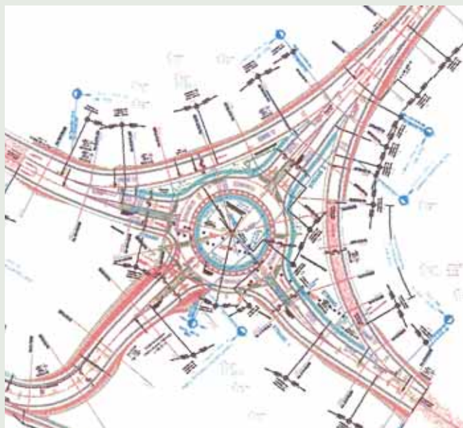
Kreisverkehr in Kärnten, Treffner Feld

Im österreichischen Bundesland Kärnten verbindet der Kreisverkehr „Treffner Feld“ den Knoten Villach Nord mit der B 94 Ossiacherstraße und der B 98 Millstätterstraße. In diesem bestehenden Kreisverkehr wurde die obere Tragschicht Typ BT 22 HS unter Verwendung von Bitumen 50/70 und 1,5 M.-% TLC 50/50 ausgeführt. Für die Deckschicht wurde ein Asphaltbeton Typ pmAB 11 Lastklasse S unter Zugabe von 1,8 M.-% TLC 50/50 verwendet.